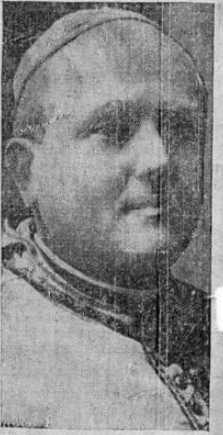
El cardenal Binet, arzobispo de Besançon, es el más probable sucesor del arzobispo de París, cardinal Du Bois, recientemente fallecido