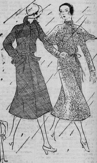
Como "en toda vida ha de caer alguna lluvia" según el proverbio inglés, es bueno prepararse a tiempo. Aquí vemos dos atractivos modelos de capas que unen a su confort la más acabada elegancia, y que serán indudablemente del agrado de nuestras lectoras